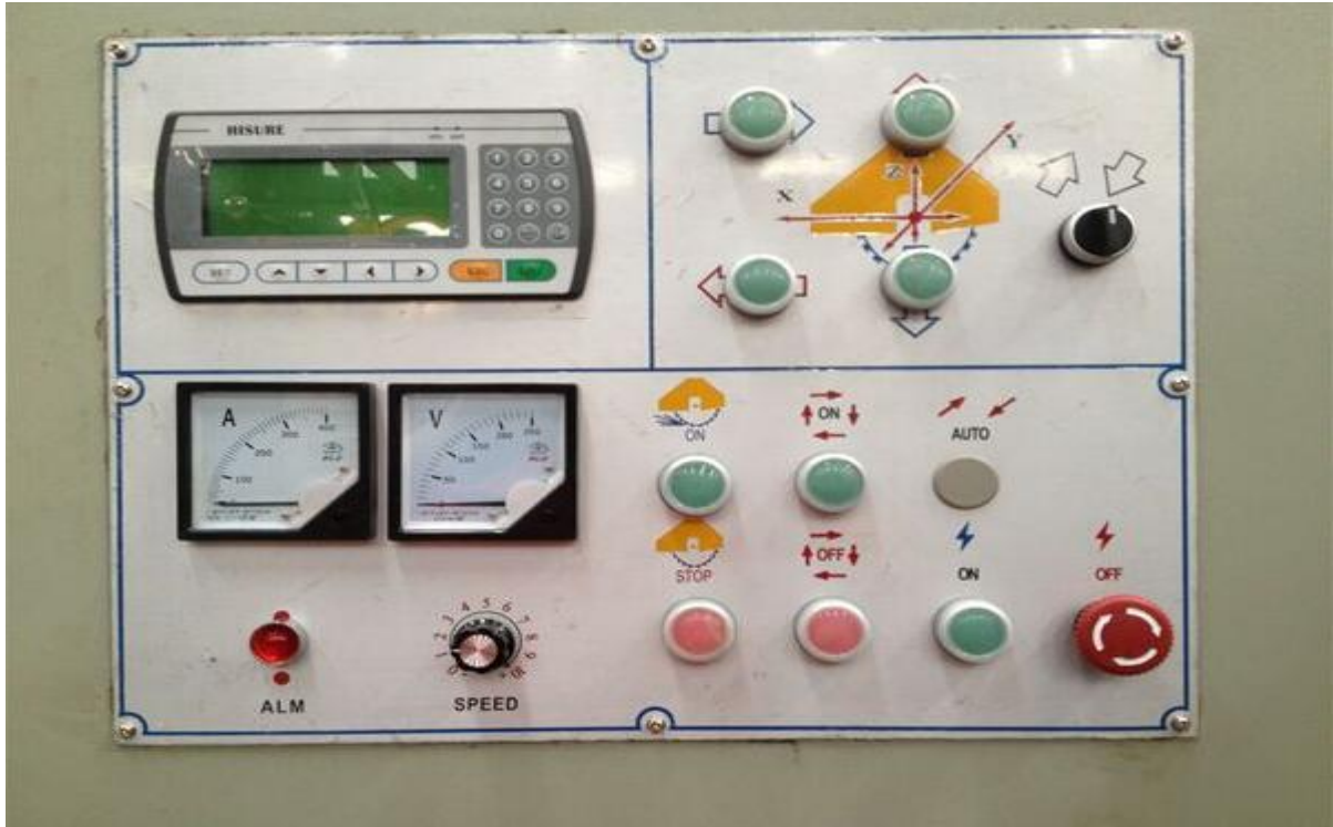
Bảng điều khiển